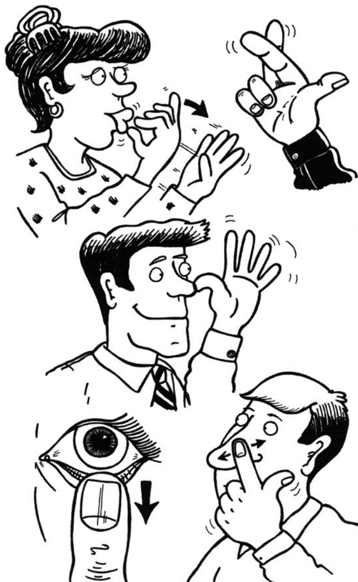
Rysunek 4.1. Niektóre popularne gesty

Skrzyżowanie palców , czyli splecenie palca wskazującego i środkowego i umieszczenie pozostałych palców pod kciukiem, może